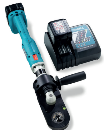
RODEUSE SUR BATTERIE