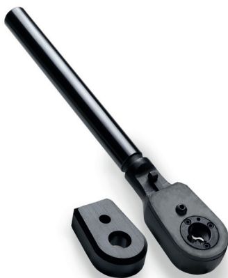
RODEUSE À CLIQUET

Dans le cas de tôles revêtues, l'électrode peut être rodée sur la face active et les flancs en une seule opération. Pendant le processus de rodage, les alliages et les copeaux sont évacués et tombent librement de la tête de fraisage.